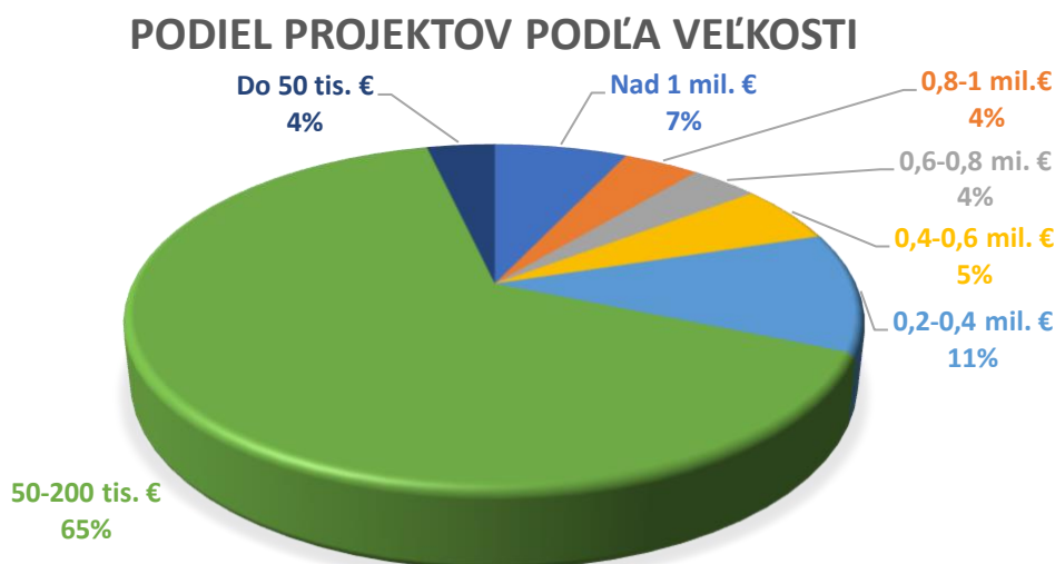
Graf č.1 Podiel projektov podľa veľkosti na celkovej alokácii

Dôležité je, že 30% projektov objemom presahovalo 200 tis. € čiže obvyklý stropný objem de minimis schémy na Slovensku. Naopak podiel projektov do 50 tis. € bol nízky.